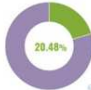
Click-to Open Rate (CTOR)