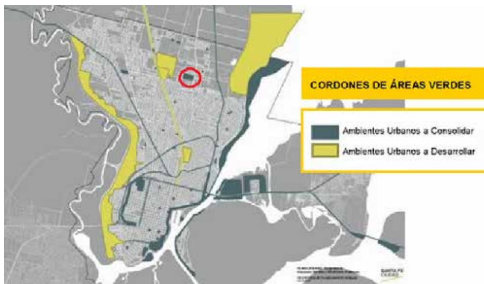
Plano de referencia de los Cordones de Áreas Verdes definidos para Santa Fe, PLAN URBANO Santa Fe Ciudad 2008-2009. Círculo rojo se ubica la Granja La Esmeralda.