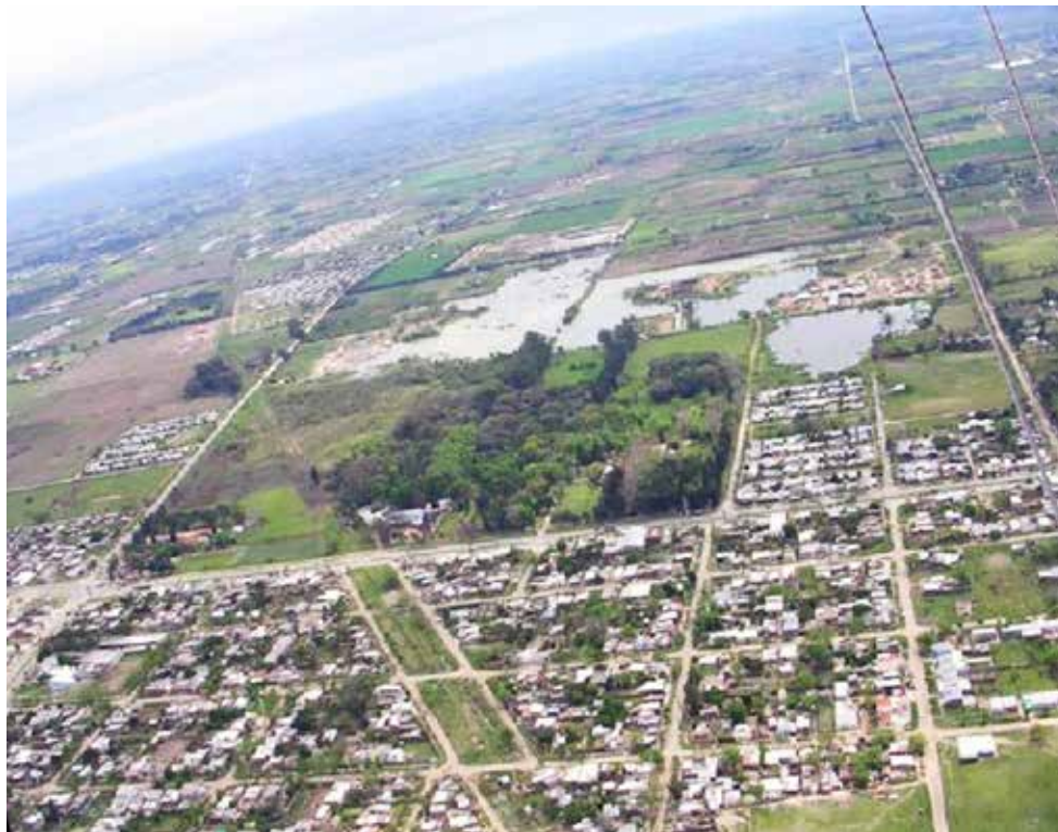
Fotografía aérea del borde Norte de la ciudad de Santa Fe, donde se visibilizan el Jardín Botánico y la Cava Borgo. Año: 2005.

pacios de resistencia de un proceso de transformación que pareciera inevitable. De esta manera, las características del área de intervención, se resumen en: precariedad de servicios, precariedad de espacios públicos, viario en consolidación, áreas de relleno sanitario, área de cavas, vinculación jardín botánico, producción hortícola en reducción (amenazada y no habilitada por la legislación urbana), riesgo hídrico.