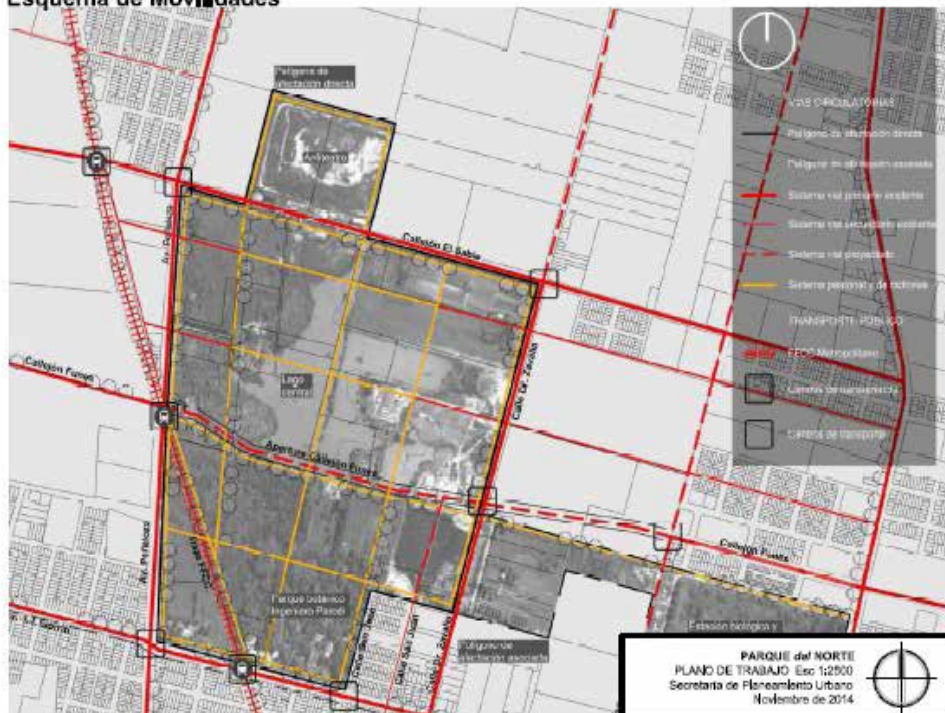
Parque del Norte. Plano de Trabajo Esc. 1: 2500: Primer Esquema: Centralidades; Segundo Esquema: Movilidades. Fuente: Secretaria de Planeamiento Urbano Municipalidad de la Ciudad de Santa Fe. Noviembre 2014